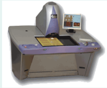
Neue AOI im Einsatz

Im Oktober 2005 wurde, nach einem umfangreichen Benchmarking aller relevanten Maschinenanbieter, eine AOI-Anlage der Firma Camtek in Betrieb genommen. Ob auf Innen- oder Außenlagen - die Orion 828 findet und meldet zuverlässig jede optische Abweichung bis 5µm gegenüber den Datenvorgaben des Kunden.